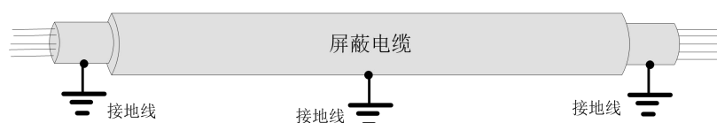
图 3 信号线接地示意图