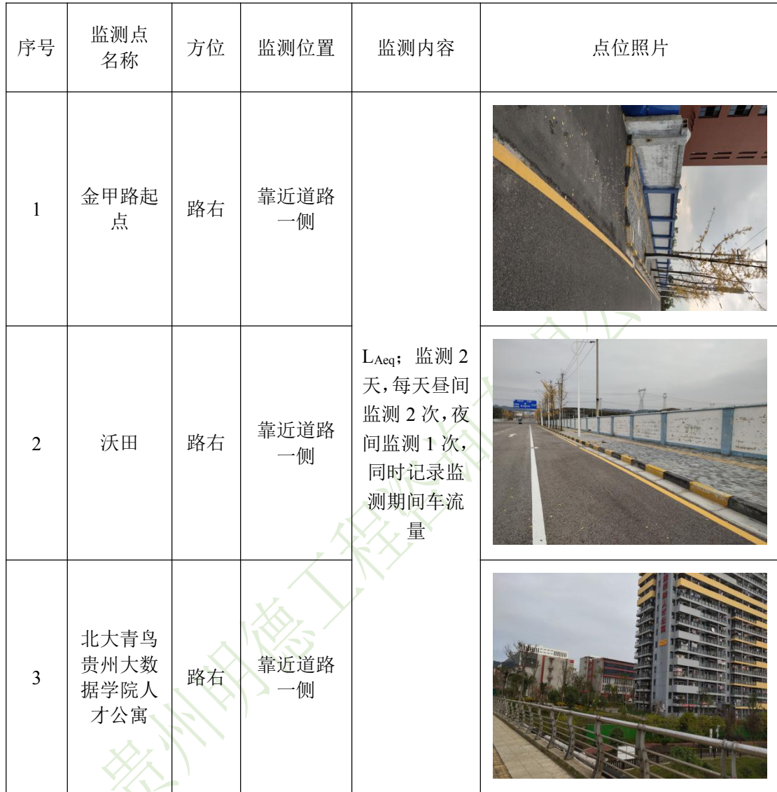
表 8-1 噪声监测点位及监测内容