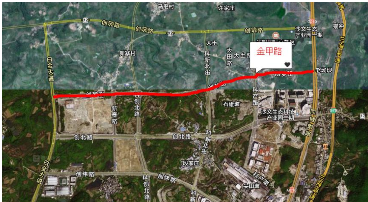
图 4-2 金甲路位置图

本项目起点接金苏大道，沿线与天竺路、新寨路、金干北路、金潘北路、大田路、金沙路相交，终点连接 210 国道线，全长 2650m；主要占用荒山和建设用地。位置图见图 4-2